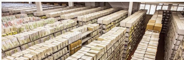
Documentação em papel