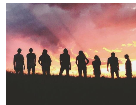
2021 Encontro da Comunidade de Prática de Formadores em BES