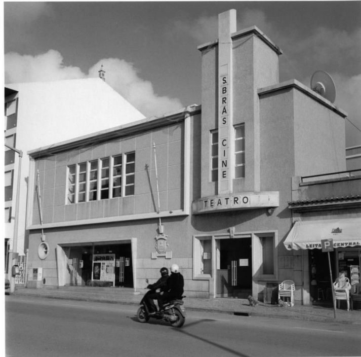
Figura 1: Cineteatro São Brás iii

A supradita fotografia de Michel Waldmann ii (Fig. 1) reproduz o Cineteatro São Brás, na avenida da Liberdade, entre 1990 e 1991. A sua produção deve ser entendida à luz da condição de fotógrafo oficial da Fundação Europália Internacional, entre elas a Europália de 1991, realizada na Bélgica, que nesse ano teve Portugal como país tema. Este evento levou-o, em 1990 e no ano seguinte, a percorrer o nosso país, com a finalidade de efetuar um inventário dos cinemas, teatros e cineteatros.