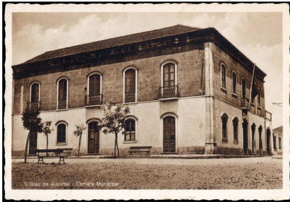
Figura 3: S. Brás de Alportel - Câmara Municipal